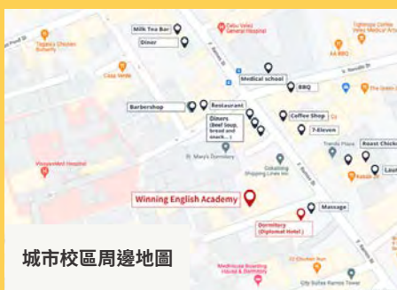
城市校區周邊地圖